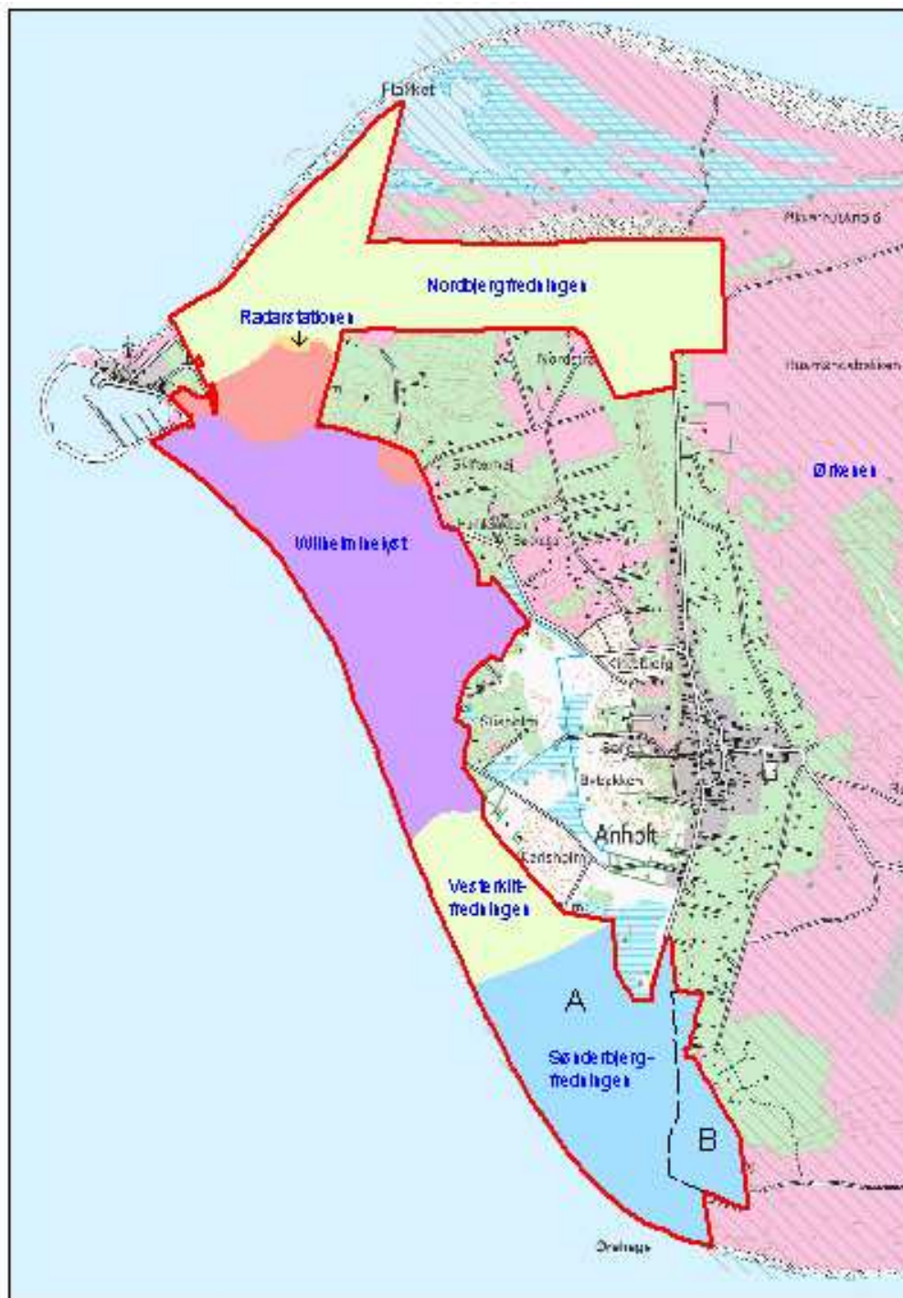
delområder med særbestemmelser

Fredningsforslagets inddeling af området i delområder. (Kortet er IKKE målfast).